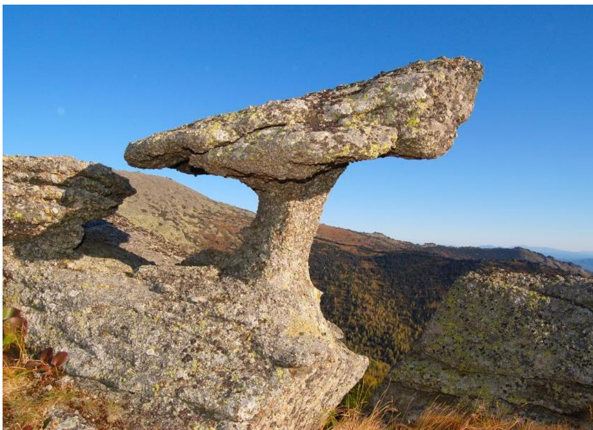
Фото 8. Каменный гриб.