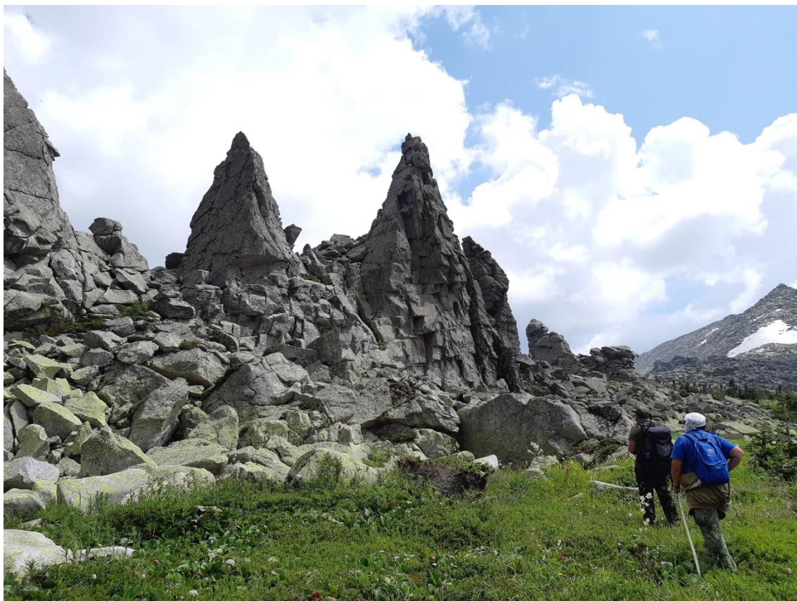
Фото 7. Гранитные останцы.