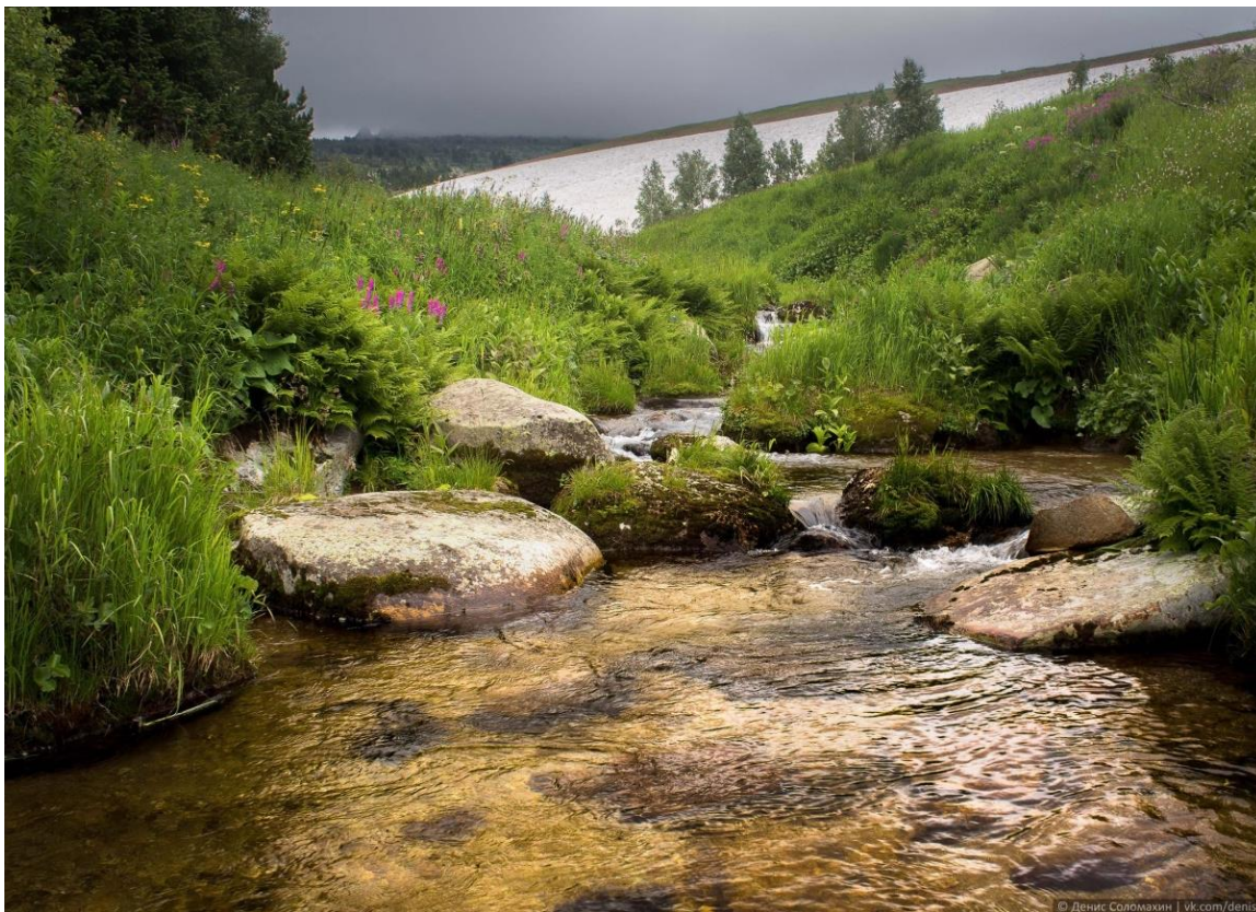
Фото 3. Истоки Большого Тигирека, вид на снежник Соколова.