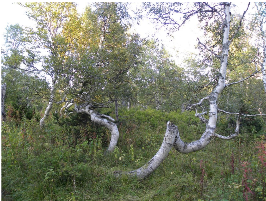
Фото 2. Субальпийское березовое криволесье.