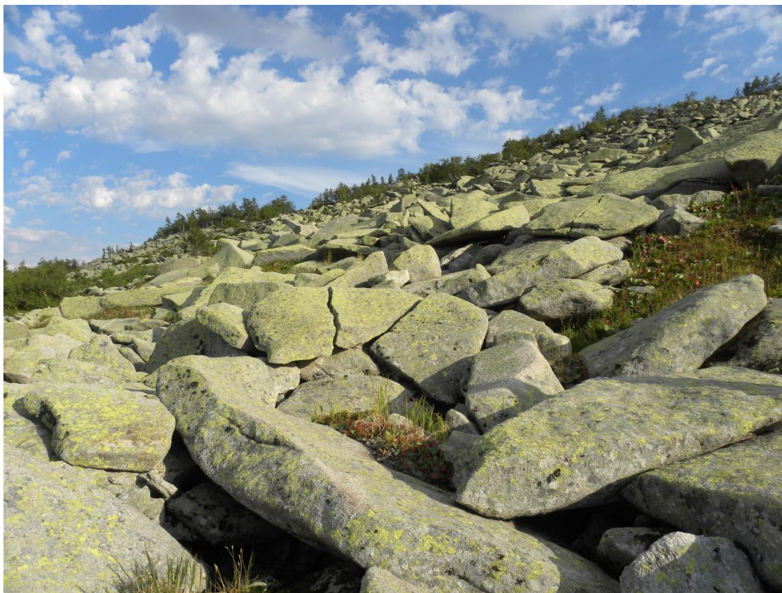
Фото 6. Склон горы Разработной.