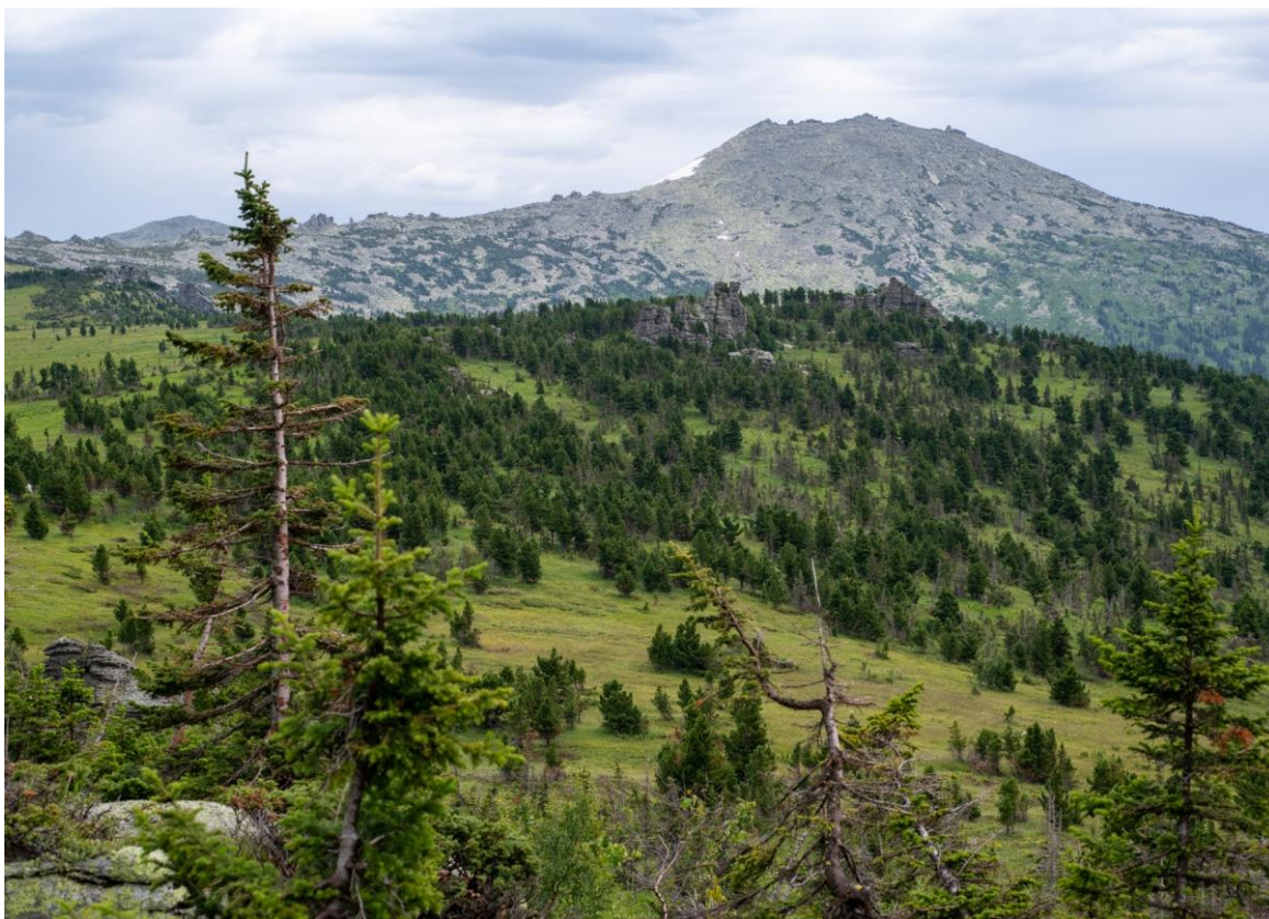
Фото 5. Вид на г. Разработную.