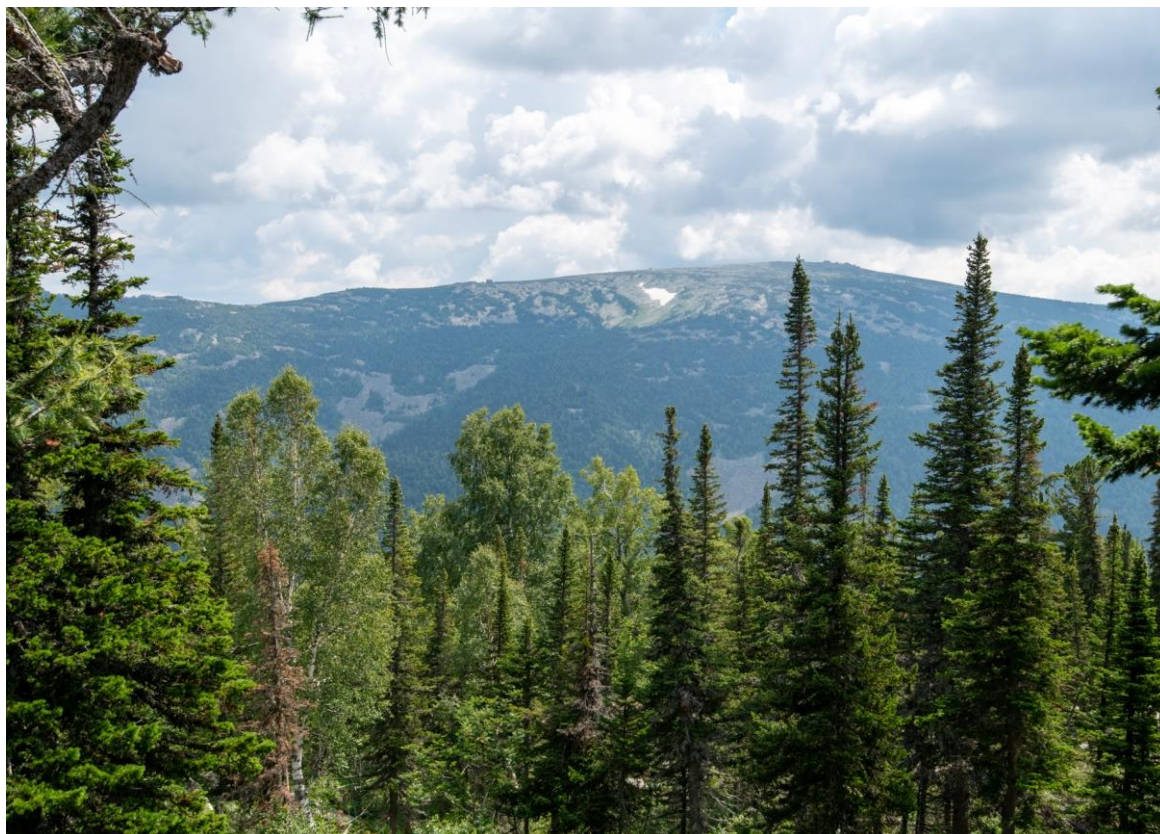
Фото 1. Черневая тайга. Автор Косачев П.А.