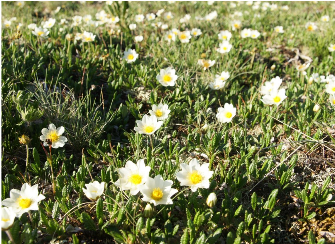
Фото 4. Дриада остроzubчатая. Автор Семенов В.В.