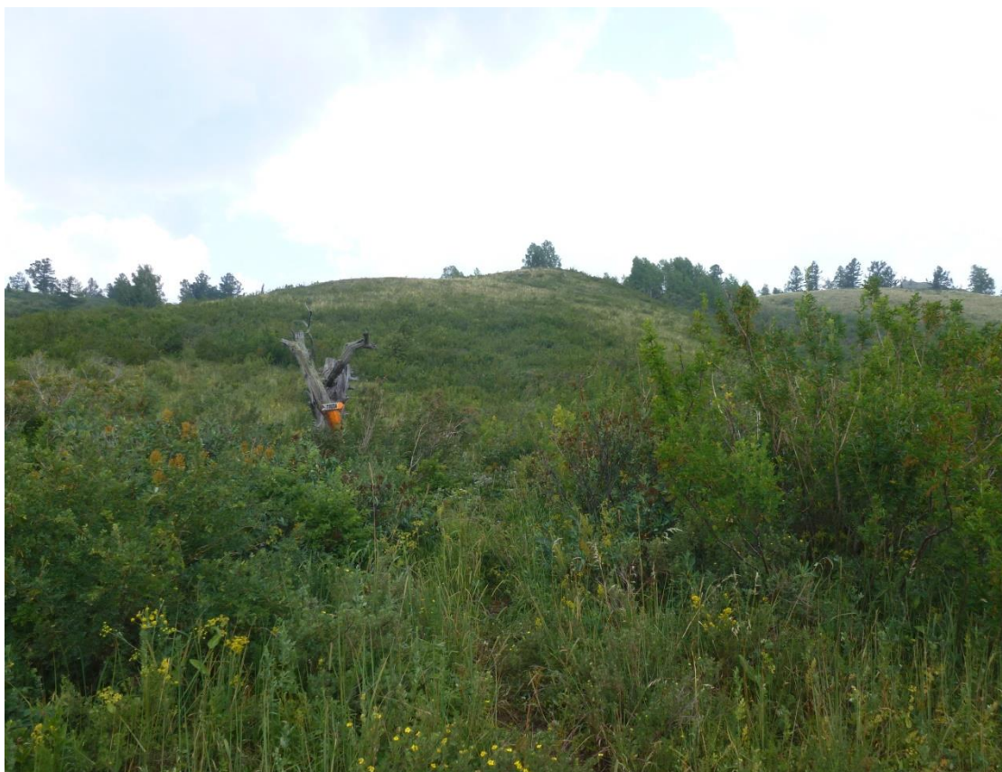
Фото 3. Южный склон г. Чайной, поворот на подъём.