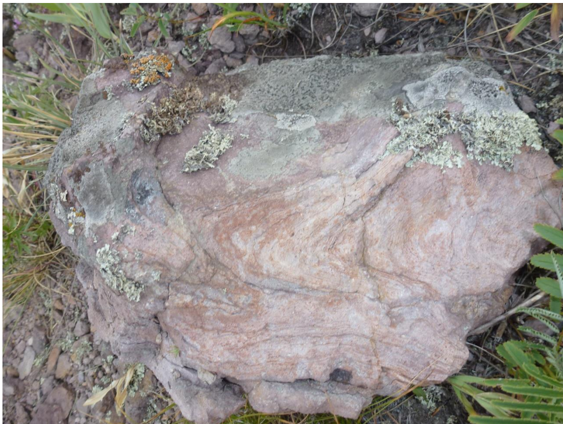
Фото 5. Складки в вулканических породах, г. Чайная.