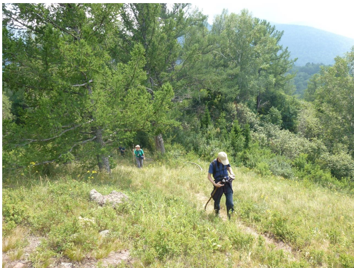
Фото 4. Выход на степной склон.