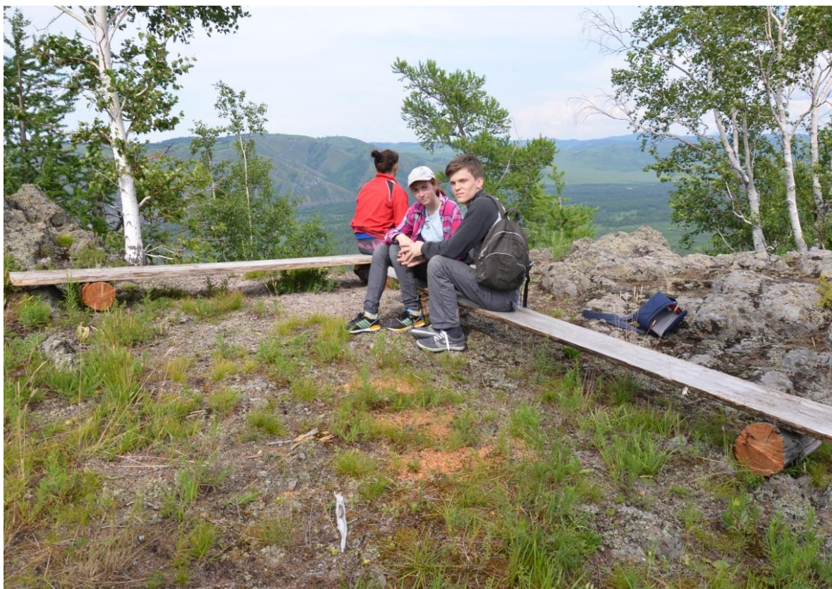
Фото 8. На смотровой площадке.