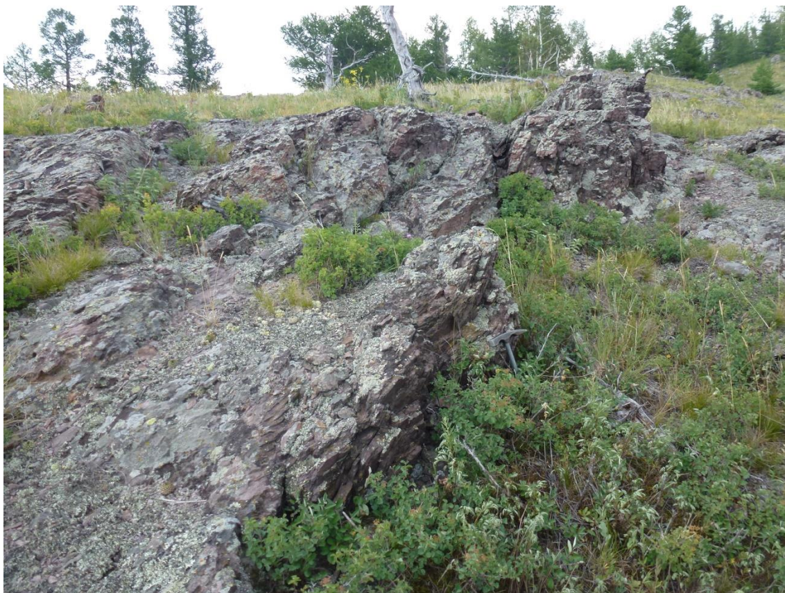
Фото 6. Флюиальность вулканических пород.