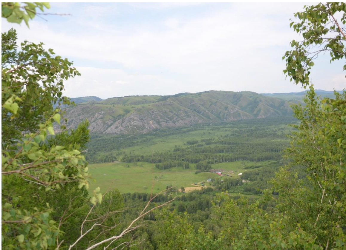
Фото 7. Вид с г. Чайной на долину р. Ини.