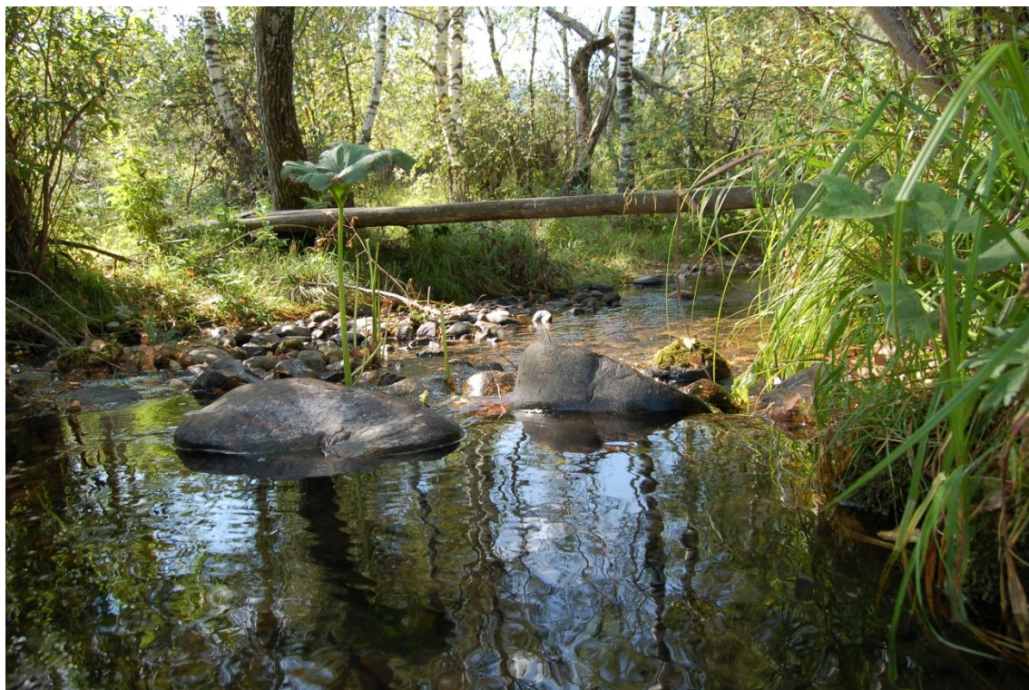
Фото 1. Мостик через рукотворный канал Воскресёнку.