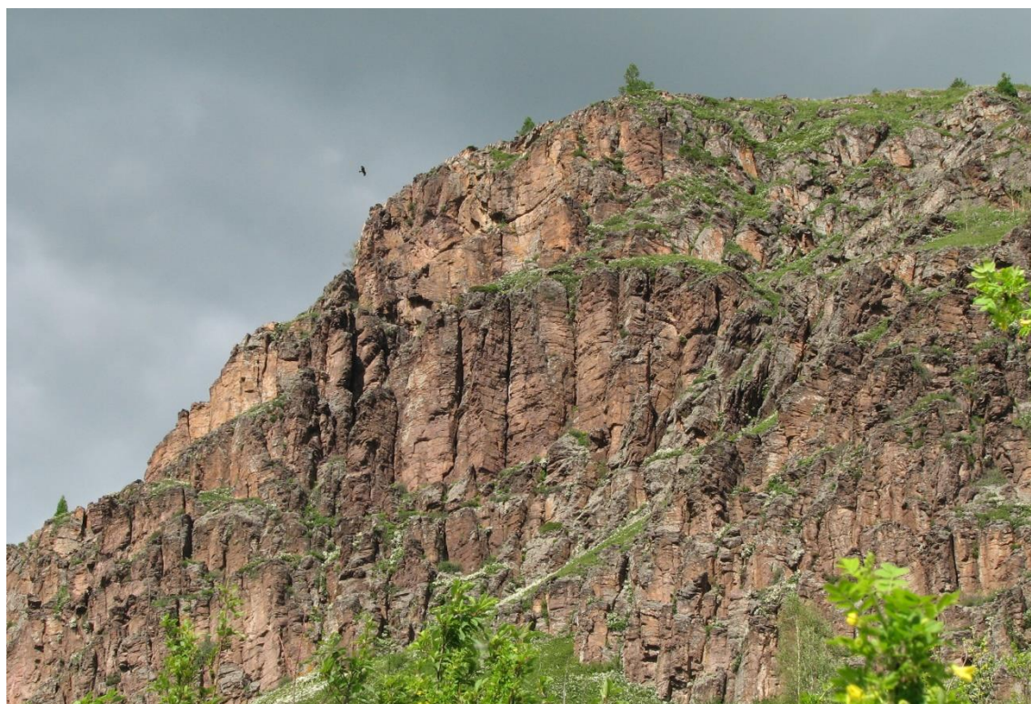
Фото 2. Крутой уступ г. Чайной.