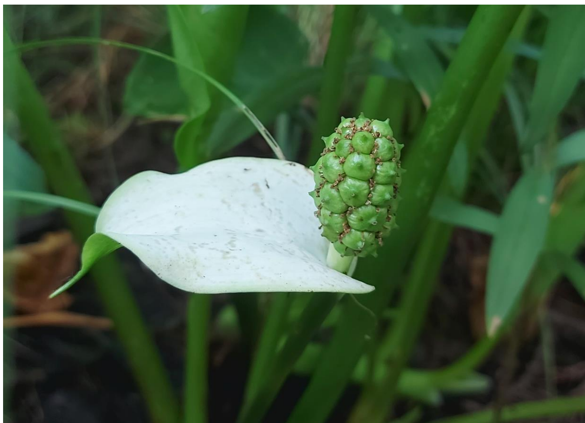
Фото 4. Болотные сообщества с белокрыльником.