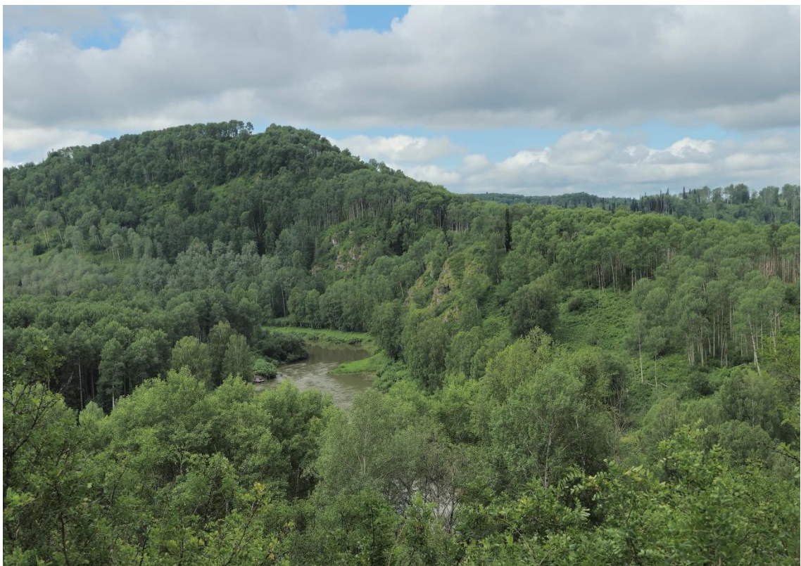
Фото 2. Гора Ягодная.