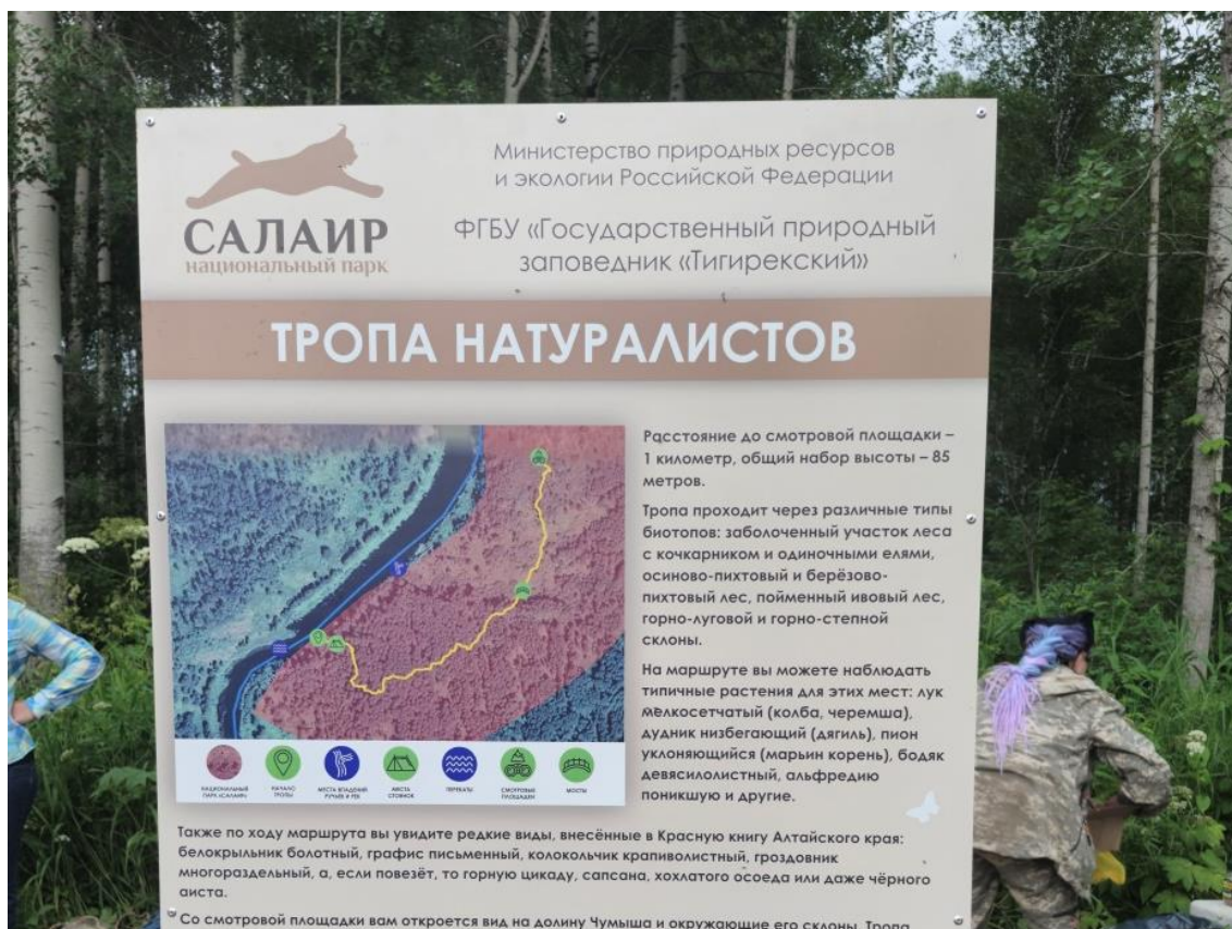
Фото 3. Стенд в начале тропы.