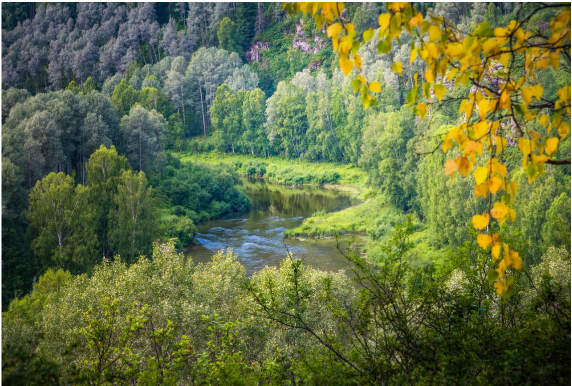
Фото 1. Вид со смотровой площадки на р. Чумыш.