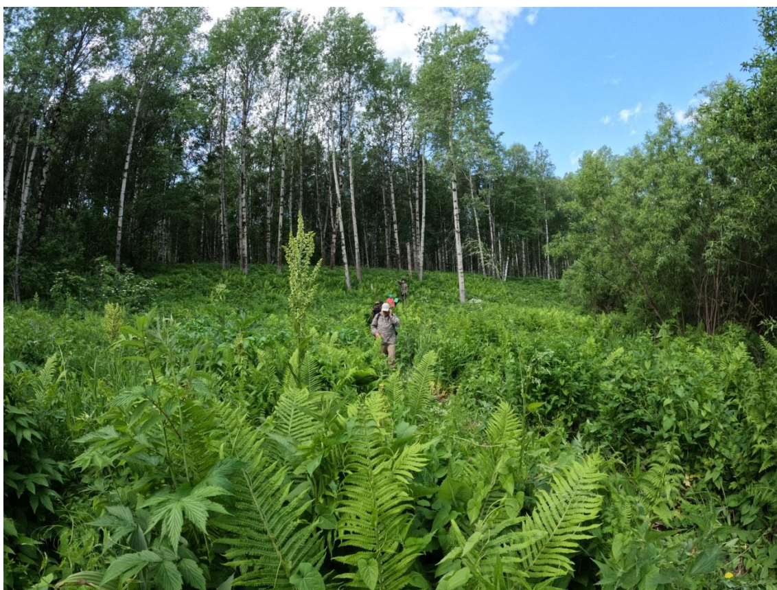
Фото 6. Тропа на г. Ягодную.