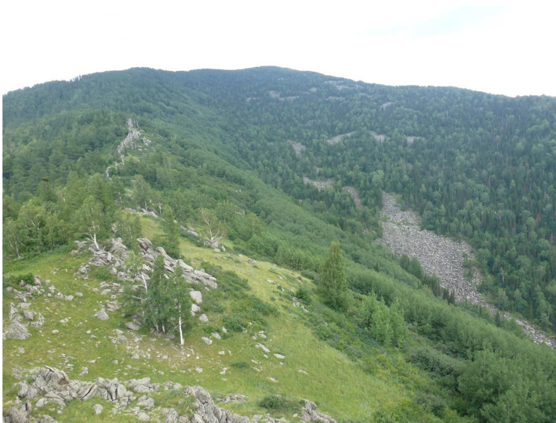
Фото 5. Извилистый линейный гребень.