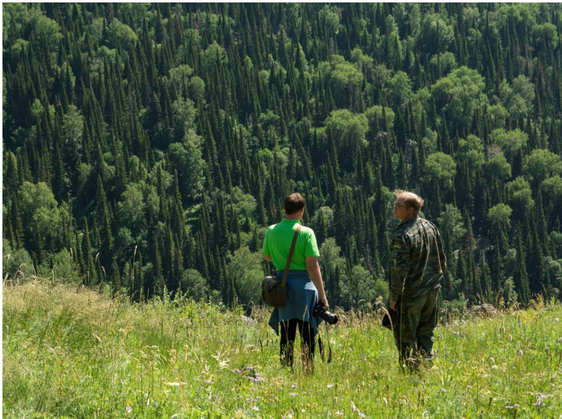
Фото 7. На смотровой площадке «Листвяжий Глядень».