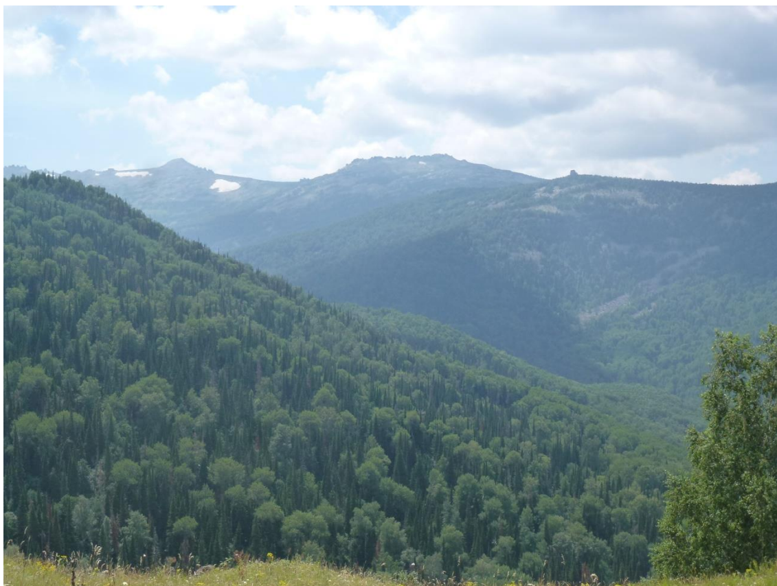
Фото 3. Вид на гору Разработную.