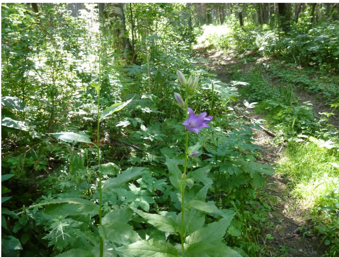
Фото 2. В пихтово-березовом лесу.