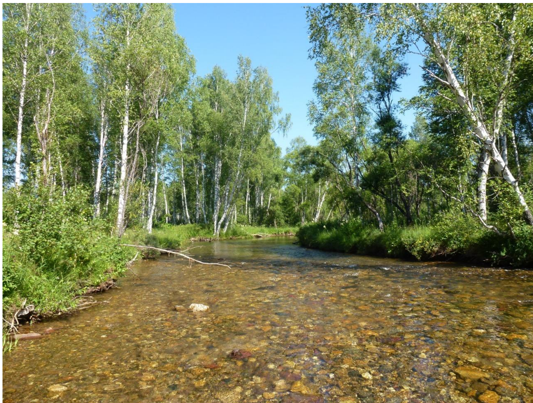
Фото 1. Брод через р. Малый Тигирек.