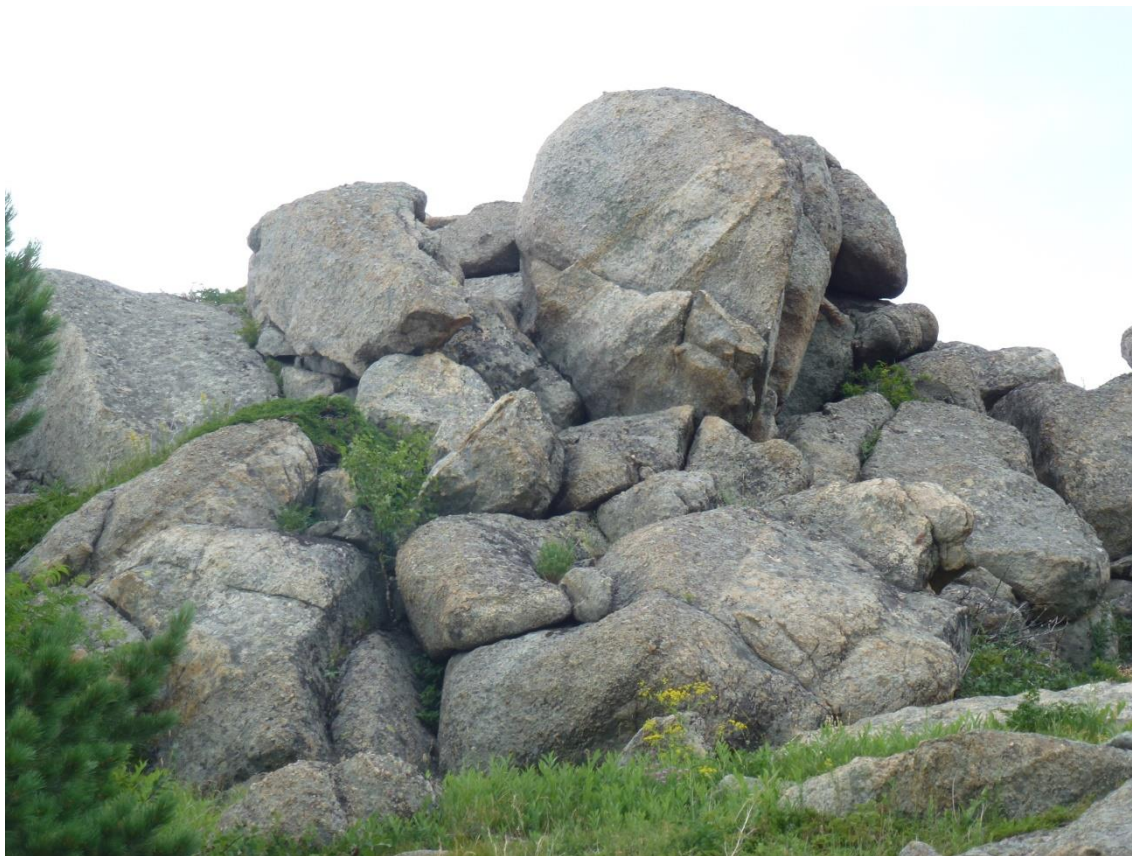
Фото 6. Денудационные останцы.