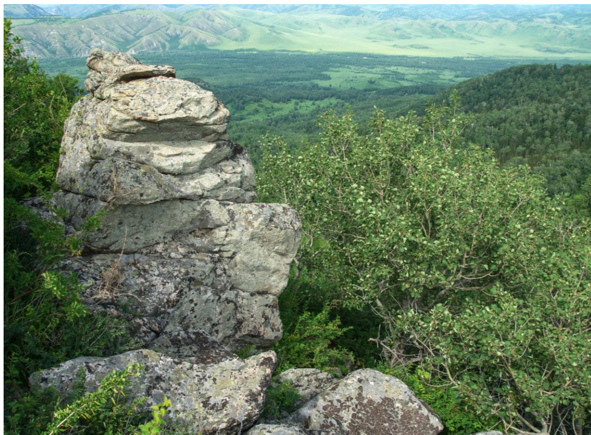
Фото 8. Вид на долину р. Ини.